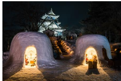
地域ならではの文化、建造物、風景