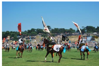
人々で賑わう祭りの臨場感やスケール感が伝わる