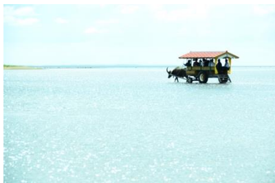
この場所ならではの風景