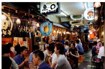
人がいて活気があり店内の雰囲気が伝わる