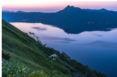
ほかでは見られないような絶景