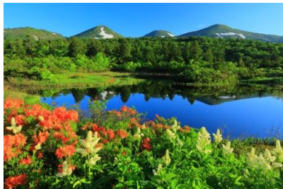
四季の花が写りスケールも伝わる構図