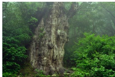
神聖な雰囲気が伝わる