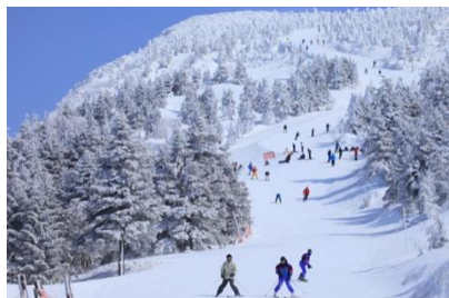
スポットだけでなく楽しんでいる人も写っている