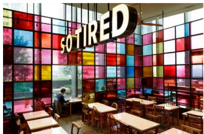
店内全体像が伝わる