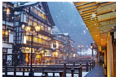
この場所にしかない景色で町の奥行きが分かる