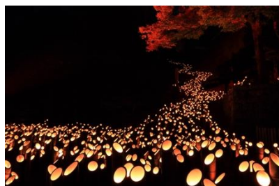
この場所でしか見られない夜景やイルミネーション