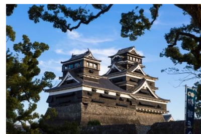
お城全体が収まっている